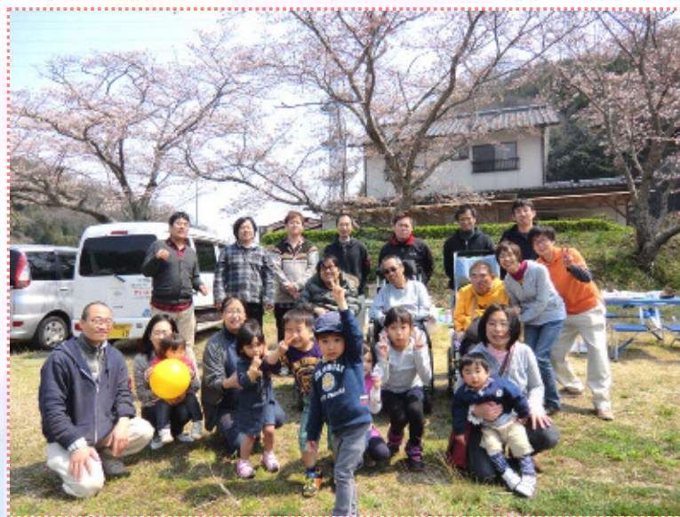
皆そろってハイ、チーズ!