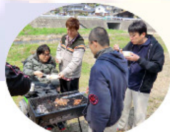
外で食べるご飯は旨い♪