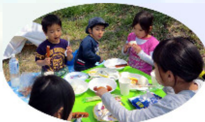
子ども達も大満足☆